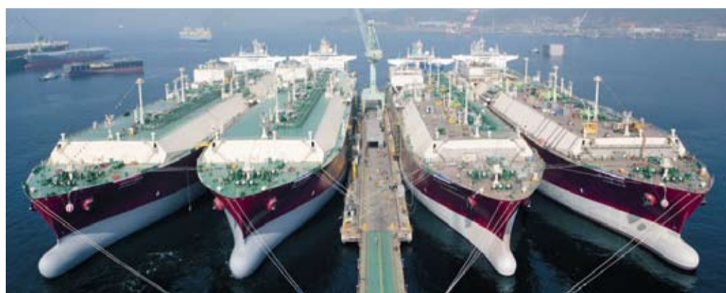
Als gas straks duurder wordt doen lng-schepen goede zaken.

De gasprijs is nu nog laag, maar zal onherroepelijk gaan stijgen zodra de economie weer aantrekt. De terugval in de vraag naar gas vanwege de recessie is slechts van tijdelijke aard. Spoedig zal het gasoverschot omslaan in een tekort.